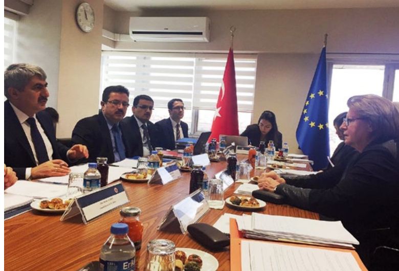
Échange de vues avec les autorités turques sur des amendements constitutionnels, Ankara, février 2017

Les dispositions du décret-loi n° 614 relatives à l'exercice de la démocratie locale suscitaient les mêmes inquiétudes, pour ce qui est du respect des règles de procédure et matérielles relatives à l'état d'urgence et