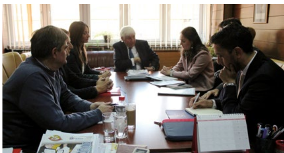
Réunion au ministère de la justice de la Serbie, Belgrade, novembre 2017

Un ancien membre de la Commission de Venise a pris part à la fin de l'année 2017, en qualité de conseiller juridique, à une série de réunions de travail des autorités serbes, à la demande du ministre de la Justice serbe. Cet appui a consisté à conseiller le ministère de la Justice dans la préparation d'une révision de la Constitution touchant à la justice.