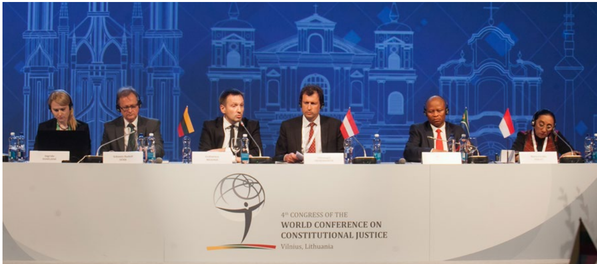
4 e session sur le droit et l'individu, 4 e congrès de la WCCJ, Vilnius, septembre 2017

à la démocratie, à la protection des droits de l'homme et à l'État de droit (article 1.2 du statut reproduit à l'annexe I).