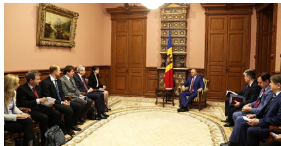
Echange de vues avec le Président de la République de Moldova M. Igor Dodon, mai 2017

Le système proposé suscite des préoccupations majeures dans le contexte spécifique, car des candidats majoritaires indépendants pourraient développer des liens avec des hommes d'affaires ou d'autres acteurs servant leurs propres intérêts. Bon nombre de personnes intéressées dans le pays ont fait part de telles préoccupations. Alors que le changement nécessite l'adoption de la législation à la faveur d'un large consensus, obtenu à la suite de vastes consultations publiques avec l'ensemble des parties prenantes concernées, le projet, bien que voté par une forte majorité, n'a pas fait l'objet d'un véritable consensus,