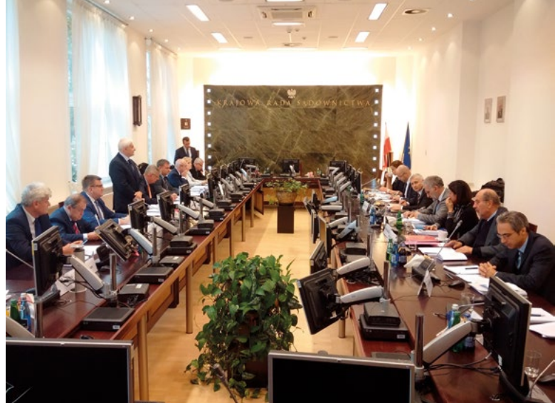
Échange des vues avec les autorités polonaises sur la Loi amendée sur le ministère public, Varsovie, octobre 2017

Le projet de loi sur la Cour suprême prévoit la révocation anticipée d'un grand nombre de ses juges par abaissement rétroactif de l'âge de la retraite. C'est une mesure malheureuse, qui affecte la durée de leurs fonctions et peut se traduire par une perte d'indépendance de la justice dans son ensemble, puisque les nouveaux juges seront nommés par le