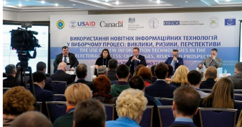
Conférence internationale sur le financement des partis politiques en Ukraine, Kiev, mars 2017.

La Commission de Venise a contribué à la conférence sur le financement des partis politiques en Ukraine: législation en vigueur, évolution récente et perspectives organisée par le Conseil de l'Europe avec le Parlement ukrainien et l'Agence nationale pour la prévention de la corruption. Plus d'une centaine de personnes ont participé aux débats, dont des représentants du Parlement, de la Commission électorale centrale, de la Cour des Comptes, de la justice et du gouvernement, ainsi que des spécialistes internationaux et nationaux du financement des partis politiques, des ONG et des médias.