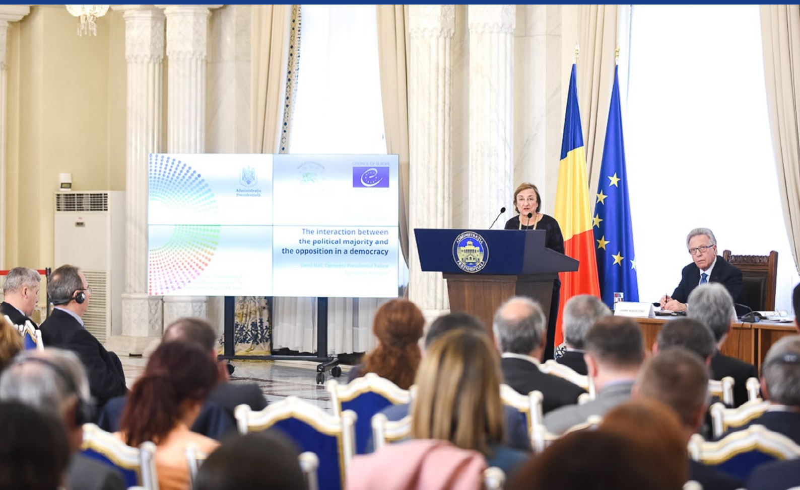
Conférence sur les interactions entre la majorité politique et l'opposition dans un régime démocratique, Bucarest, avril 2017