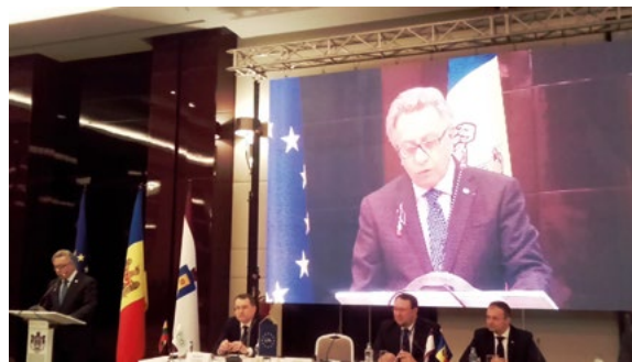
Le Président Buquicchio ouvre la Conférence sur l'évolution du contrôle constitutionnel en Europe, Chisinau, mars 2017

Le mémoire concluait qu'il était nécessaire de trouver un équilibre entre l'immunité des juges, qui permet de les protéger contre les pressions indues et les abus de pouvoir de l'État ou d'autres personnes (immunité fonctionnelle), et le fait qu'un juge n'est pas au-dessus des lois (obligation de rendre des comptes). Seuls les manquements intentionnels, impliquant un abus délibéré ou – de manière défendable – une négligence répétée, grave ou grossière, devaient pouvoir donner