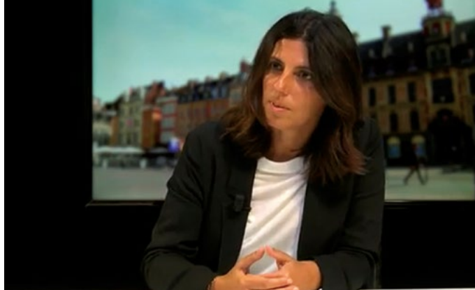
La Secrétaire adjointe de la Commission de Venise Mme Simona Granata-Menghini, Masterclass: Acteurs mondiaux pour la paix, Lille, septembre 2017

La Commission a adopté un avis sur la législation de la République de Moldova en matière de financement des partis politiques et des campagnes électorales. La Commission a coopéré avec l'OSCE/BIDDH à la révision des lignes directrices conjointes sur la réglementation des partis politiques.