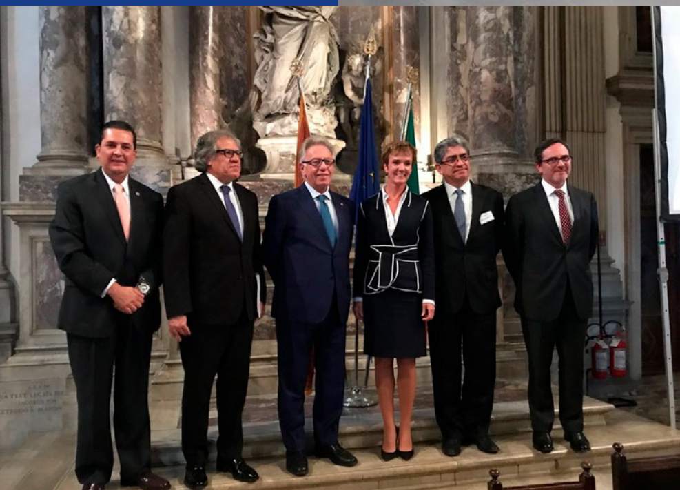
Les représentants de l'OEA, le Président de la Commission de Venise et les membres de la Commission pour les Etats-Unis, le Pérou et le Chili, Venise, octobre 2017