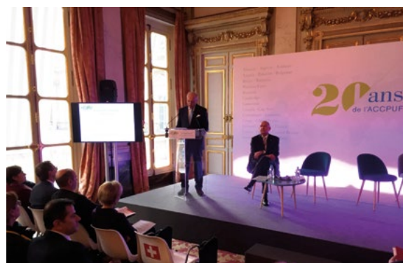
Séminaire-conférence de l'ACCPUF sur « l'écriture des décisions », à l'occasion du son 20 e anniversaire, Paris, novembre 2017

La Commission de Venise a continué d'intégrer la jurisprudence des cours membres de l'ACCPUF dans la base de données CODICES, en vertu de l'Accord de Vaduz et de son Protocole de Djibouti conclus avec l'ACCPUF.