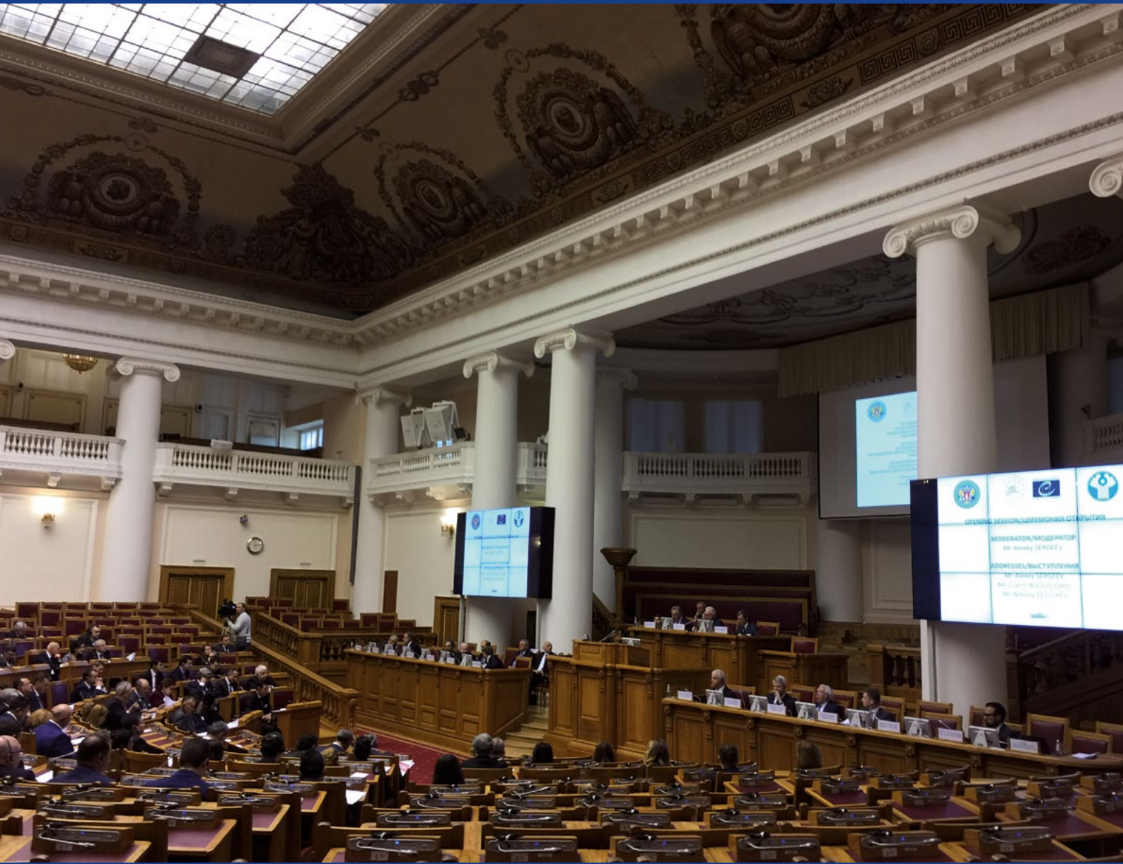
14 e Conférence européenne des administrations électorales, Saint-Pétersbourg, mai 2017