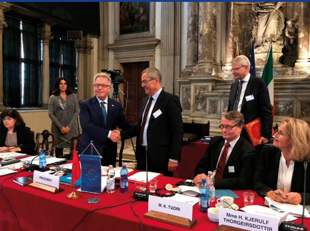
Signature d'un mémorandum d'entente entre la Commission de Venise et le Ministère de la Réforme de l'Administration et de la Fonction publique du Maroc, session plénière de la Commission, Venise, octobre 2017