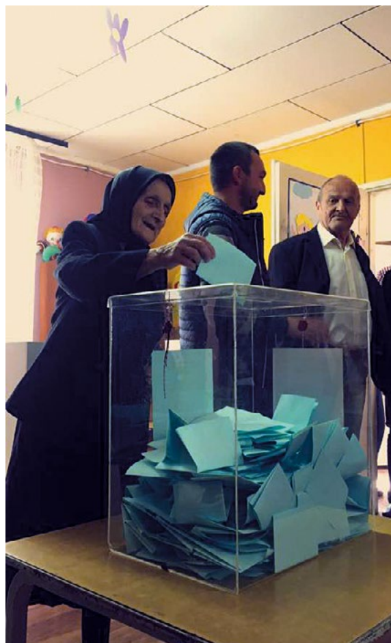
Election présidentielle du 2 avril 2017 en Serbie