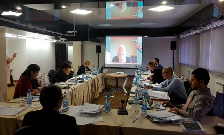
Session de travail sur le développement d'une nouvelle stratégie de réforme électorale en République kirghize, Koi-Tach, novembre 2017