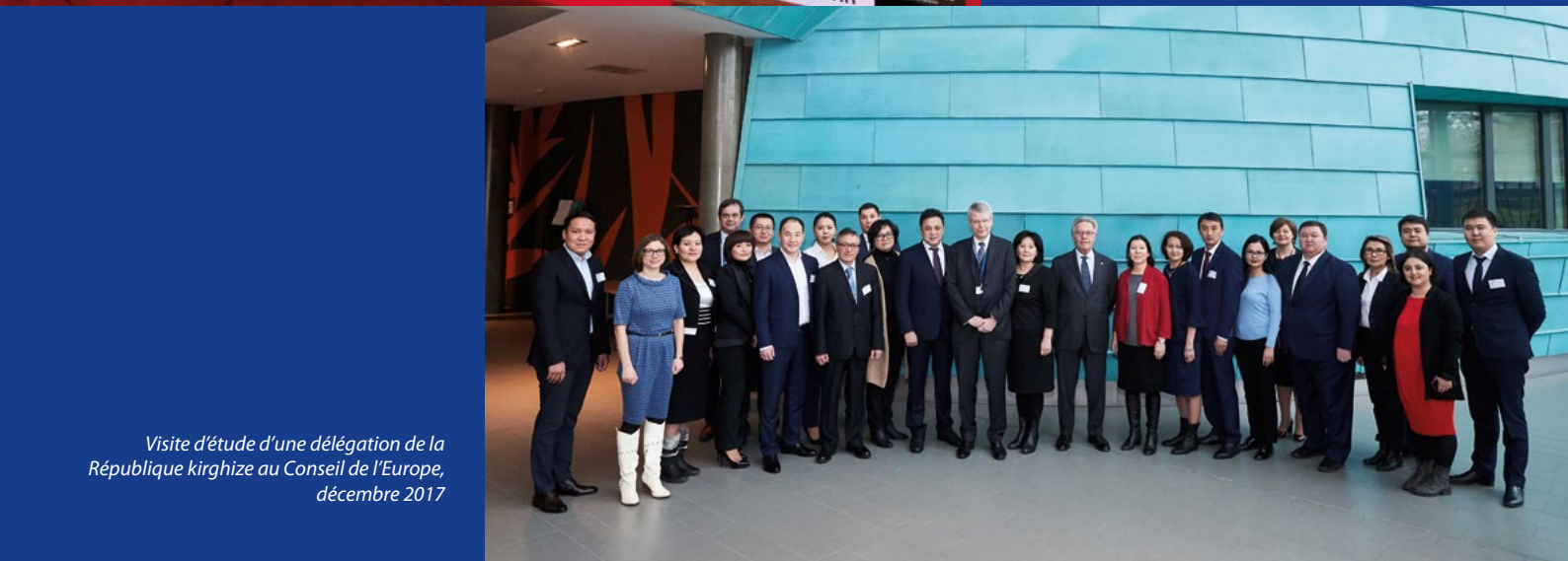
Visite d'étude d'une délégation de la République kirghize au Conseil de l'Europe, décembre 2017