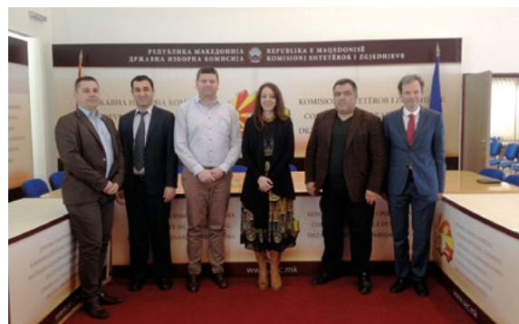
Participants de la réunion à la Commission électorale de « l'ex-République yougoslave de Macédoine », Skopje, mars 2017

Une délégation de la Commission de Venise a accompagné la mission d'observation de l'Assemblée parlementaire du Conseil de l'Europe (APCE) afin de conseiller sur le cadre juridique de l'élection présidentielle qui s'est déroulée le 2 avril 2017 en Serbie. La délégation de l'Assemblée parlementaire a observé l'ouverture du scrutin, son déroulement et les opérations de dépouillement.