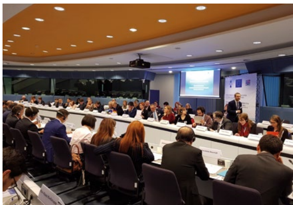
5 e Conférence des ministres de la Justice d'Asie centrale et de l'Union européenne sur l'état de droit, Bruxelles, décembre 2017

La Commission de Venise a aussi préparé une proposition de coopération avec les autorités kirghizes dans le domaine électoral. La réalisation du projet conjoint signé fin 2016 et financé par l'Union européenne et le Conseil de l'Europe a démarré en janvier 2017.