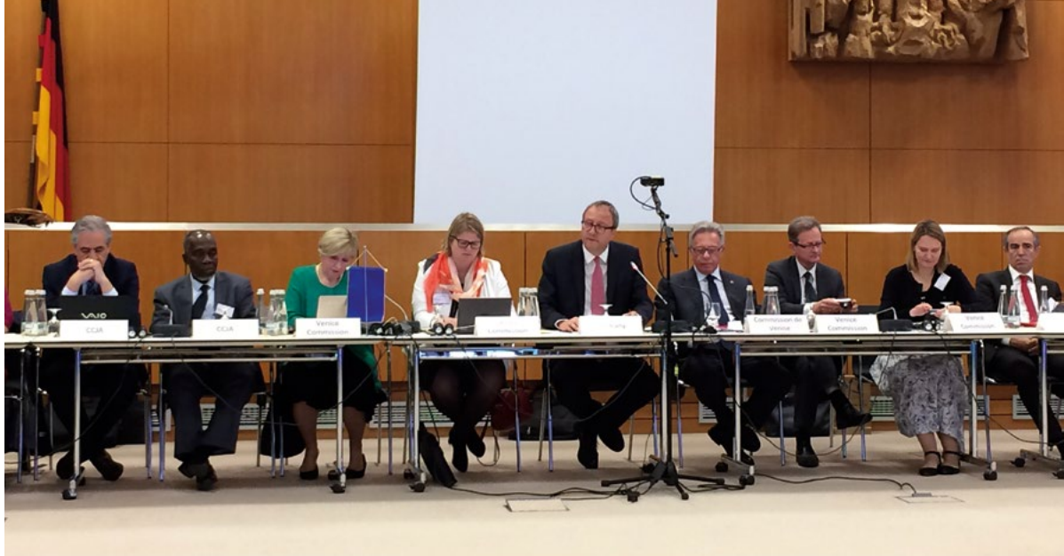
16 e réunion du Conseil mixte de justice constitutionnelle, Cour constitutionnelle fédérale d'Allemagne, Karlsruhe, mai 2017