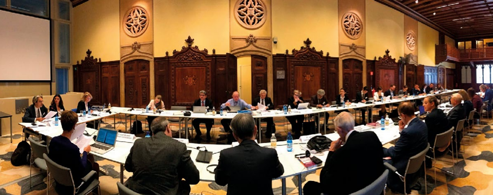
Table-ronde sur le financement étranger des organisations non-gouvernementales, Venise, octobre 2017

Le premier projet visait à créer une haute cour anticorruption qui connaîtrait des affaires de grande corruption, avec une chambre d'appel spéciale au sein de la Cour suprême ; le second prévoyait que dans tous les tribunaux, des juges spécialisés entendraient toutes les affaires de corruption. Les mesures définies dans le second projet semblaient manquer de réalisme et de nécessité au regard du principal problème à résoudre, à savoir l'inefficacité du traitement des affaires de grande corruption dans les tribunaux ordinaires. Il semblait nécessaire de mettre en place en Ukraine une cour spécialisée dans la lutte contre la corruption, avec une composante internationale dans le mode de sélection des juges, eu égard à la délicatesse et à la complexité particulières des affaires de grande corruption. Il convenait en même temps de ne pas compromettre la crédibilité de la réforme en cours de la justice. Le premier projet fournissait une bonne base de création de la haute cour anticorruption, conforme aux normes du Conseil de l'Europe et de la Commission de Venise, mais plusieurs recommandations seraient à prendre en compte, en particulier en ce qui concernait la constitutionnalité du projet. Il était souhaitable que le Président de la République soumette au Parlement son propre projet de loi, reprenant les recommandations de la Commission.