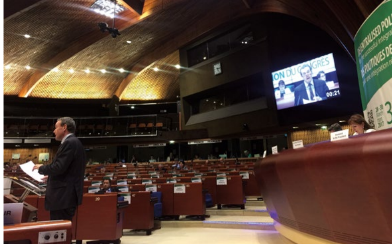
Présentation de l'avis de la Commission concernant la Liste des critères du Congrès des pouvoirs locaux et régionaux du Conseil de l'Europe sur l'utilisation abusive des ressources administratives pendant les processus électoraux aux niveaux local et régional, 32 e session du Congrès, Conseil de l'Europe, Strasbourg, mars 2017

En réponse à une demande du Secrétaire général du Congrès des pouvoirs locaux et régionaux du Conseil de l'Europe faite le 25 janvier 2017, la Commission de Venise a adopté à sa session de mars 2017 un avis sur la Liste de critères en vue de l'évaluation du respect des normes et bonnes pratiques internationales en matière de prévention de l'utilisation abusive de ressources administratives dans le cadre des processus électoraux au niveau local et régional . Cette liste devrait compléter les Lignes directrices conjointes de la Commission de Venise et de l'OSCE/BIDDH visant à prévenir et à répondre