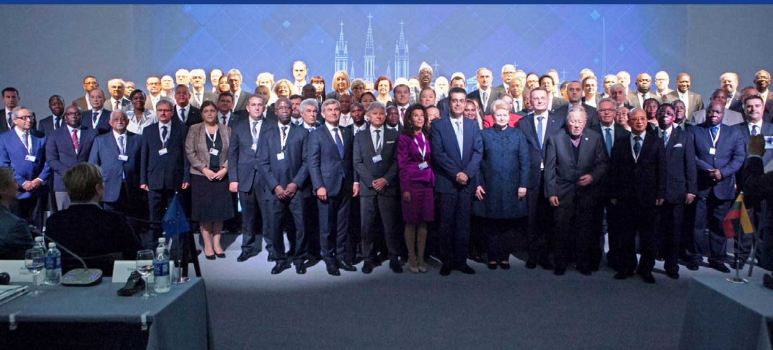
Participants de la 4 e Conférence mondiale de la justice constitutionnelle, Vilnius, septembre 2017