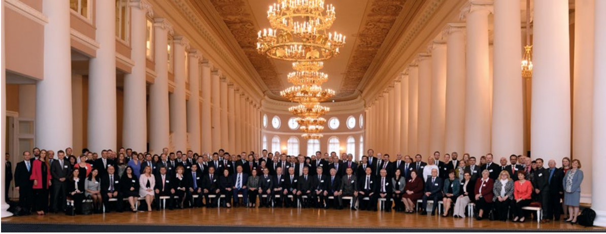
Participants de la 14 e Conférence européenne des administrations électorales, Saint-Pétersbourg, mai 2017

cas. Le rapport souligne que la géométrie électorale (y compris le gerrymandering ) est un défi pour le suffrage égal, et donc pour la démocratie.