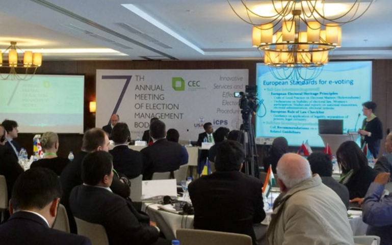
7 e réunion annuelle des administrations électorales, Borjomi, février 2017