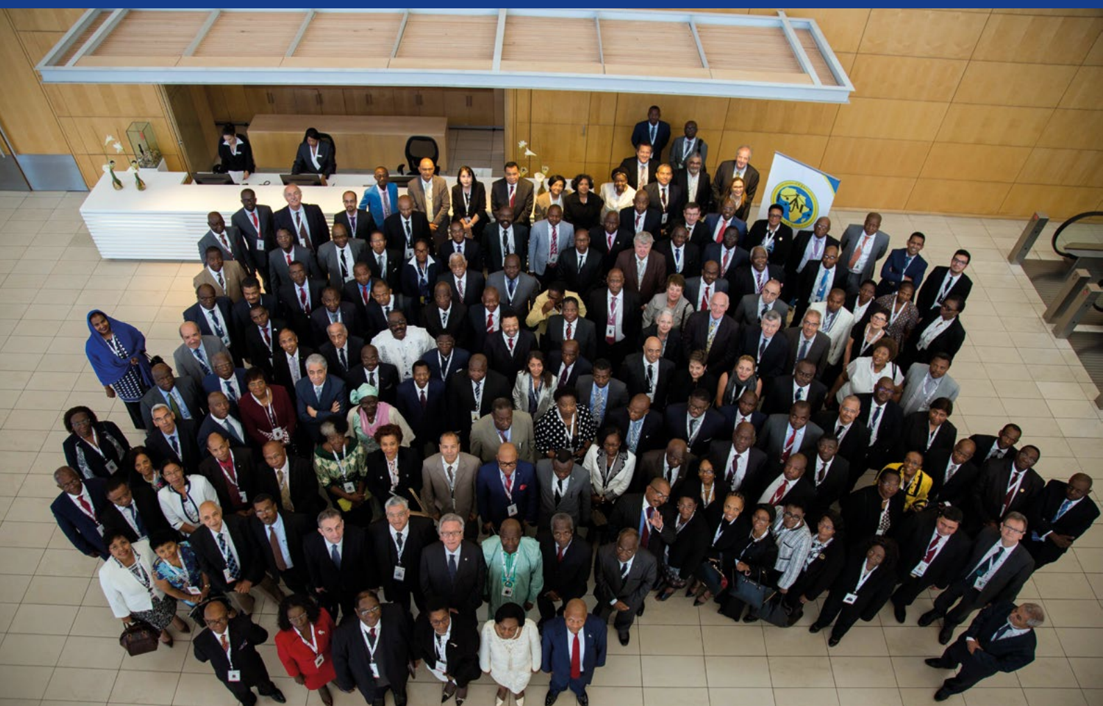
IV e Congrès de la Conférence des juridictions constitutionnelles africaines (CJCA), le Cap, avril 2017