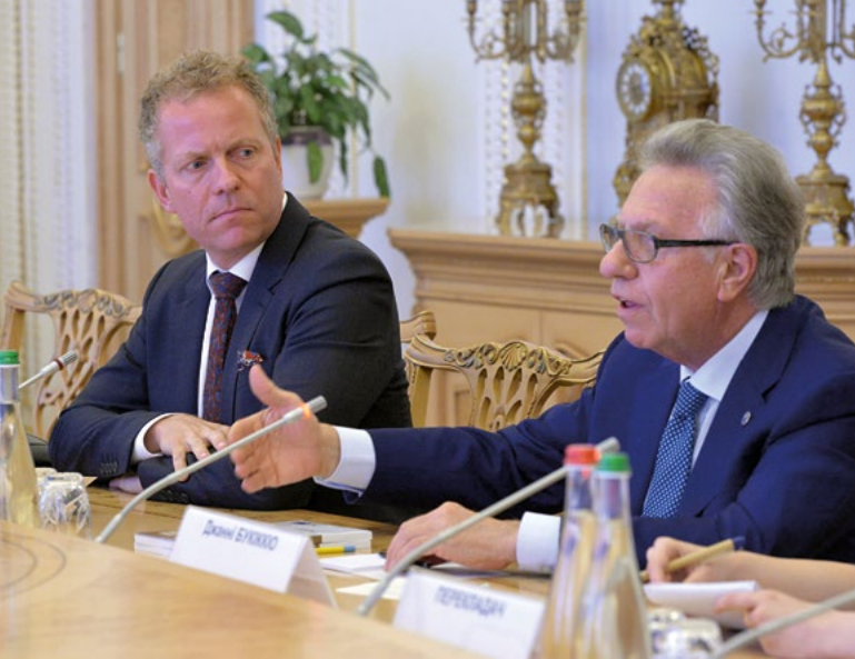
Le Président de la Commission de Venise M. Gianni Buquicchio et le Chef de bureau du Conseil de l'Europe en Ukraine M. Mårten-Ehnberg à la Verkhovna Rada, Kiev, juin 2017

Aux yeux de la Commission, l'article 7 de la loi centre le système sur l'emploi obligatoire de l'ukrainien dans l'éducation, ce qui permet de réduire sensiblement l'envergure de l'éducation dans les langues des minorités, notamment dans le secondaire. De plus, le traitement moins favorable des langues des minorités qui ne sont pas des langues officielles de l'UE, en particulier le russe, suscite des problèmes de discrimination (l'article 7 prévoit que ces langues ne peuvent être utilisées dans l'enseignement qu'au niveau préscolaire et primaire).