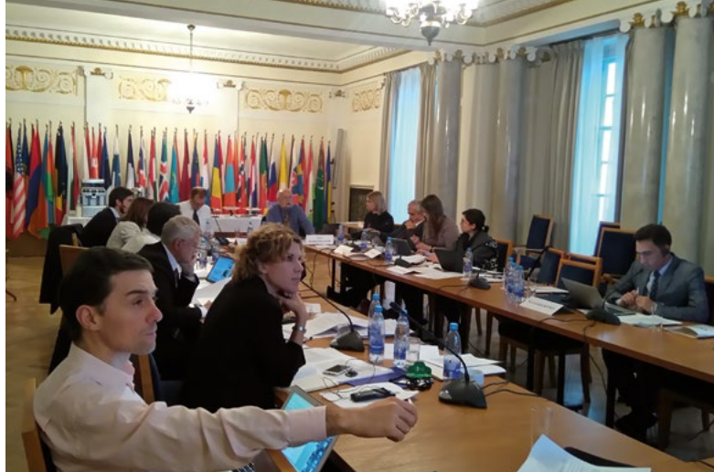
Réunion annuelle du Groupe d'experts sur les partis politiques, OSCE/BIDDH, Varsovie, novembre 2017

de l'OSCE sur la dimension humaine (Varsovie, 23 septembre 2017).