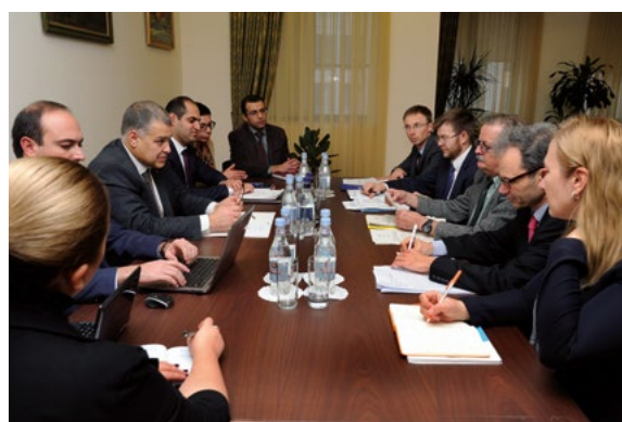
Réunion au ministère de la Justice de l'Arménie, Erevan, novembre 2017

L'avis souligne ce qui suit. Le projet de loi doit donner effet aux nouvelles dispositions de la Constitution concernant divers types de référendums nationaux, par une loi constitutionnelle nécessitant l'approbation des 3/5 des parlementaires. La Constitution prévoit divers cas de référendums : constitutionnel obligatoire,