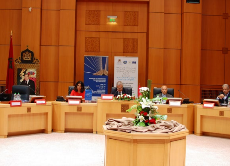
5 e Séminaire UniDem Med sur la prévention de la corruption dans la fonction publique, Rabat, septembre 2017

Plus de 20 collaborateurs de différentes institutions de médiateurs ont discuté et échangé les meilleures pratiques quant au rôle du médiateur quand il traite des droits des migrants au cours de leur parcours migratoire et de la déontologie des forces de sécurité.