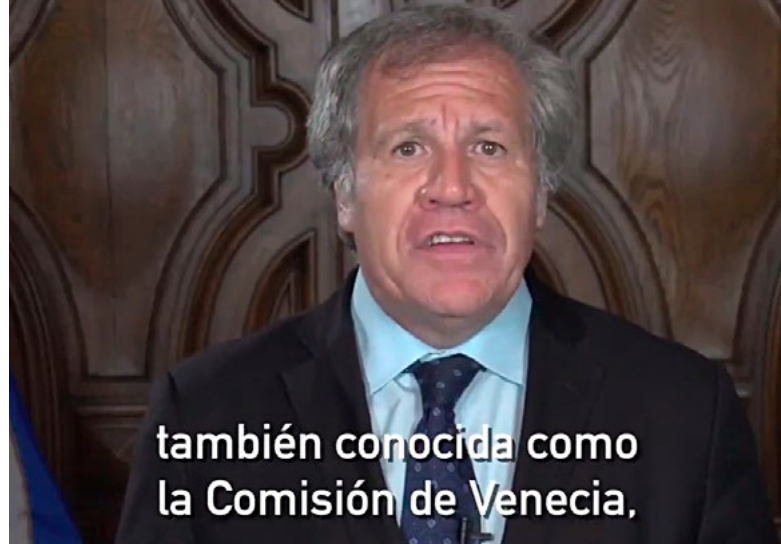
Le Secrétaire Générale de l'OEA M. Luis Almagro annonce la demande d'avis de la Commission de Venise sur la légitimité de l'Assemblée nationale constituante du Venezuela

À la seconde question, la Commission a répondu que, conformément au principe de l'État de droit, et comme le prévoit la Constitution du Venezuela, le pouvoir de