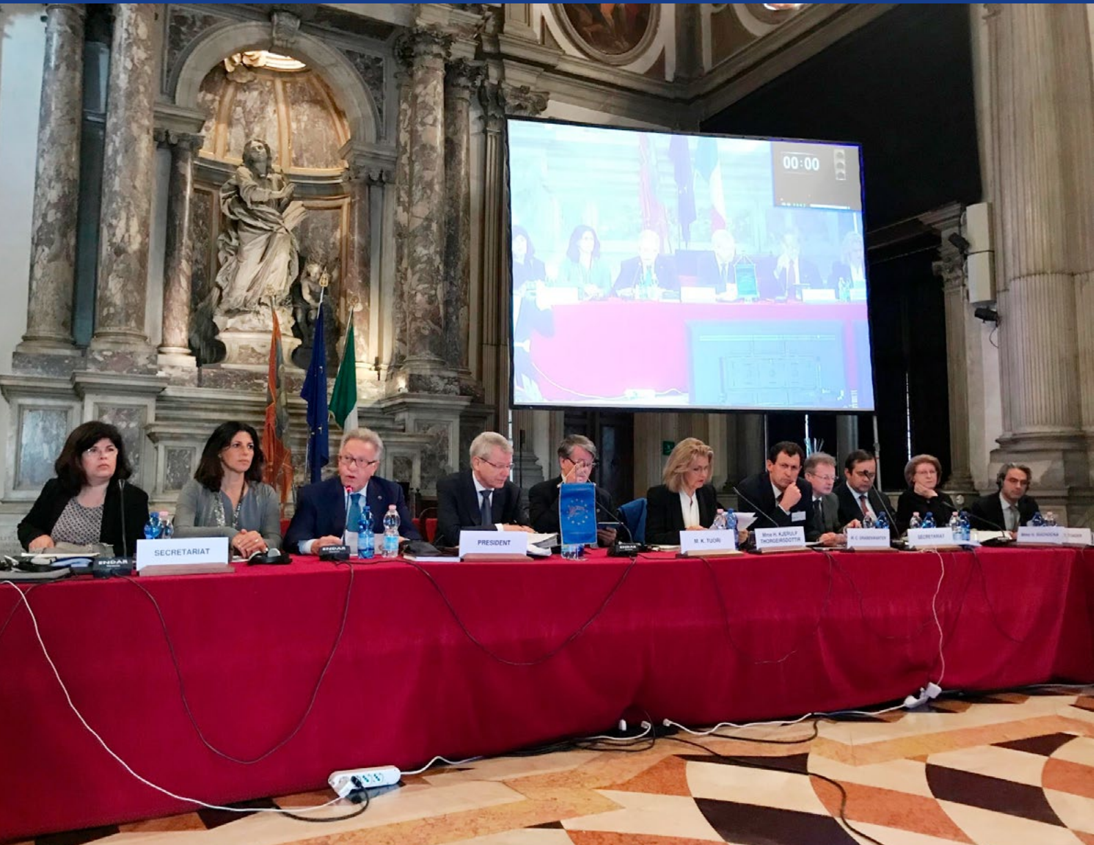
Session plénière de la Commission de Venise, octobre 2017