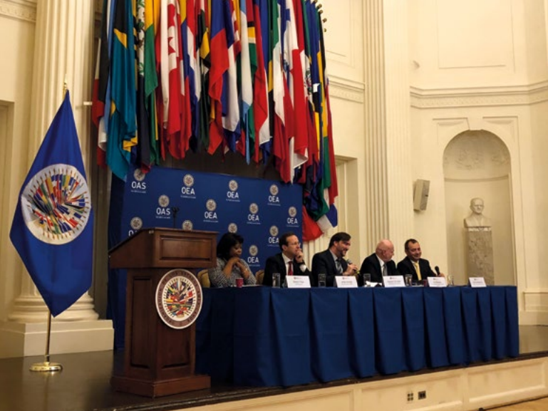
12 e réunion de l'OEA sur la Déclaration de principes de l'observation internationale des élections, Washington, décembre 2017