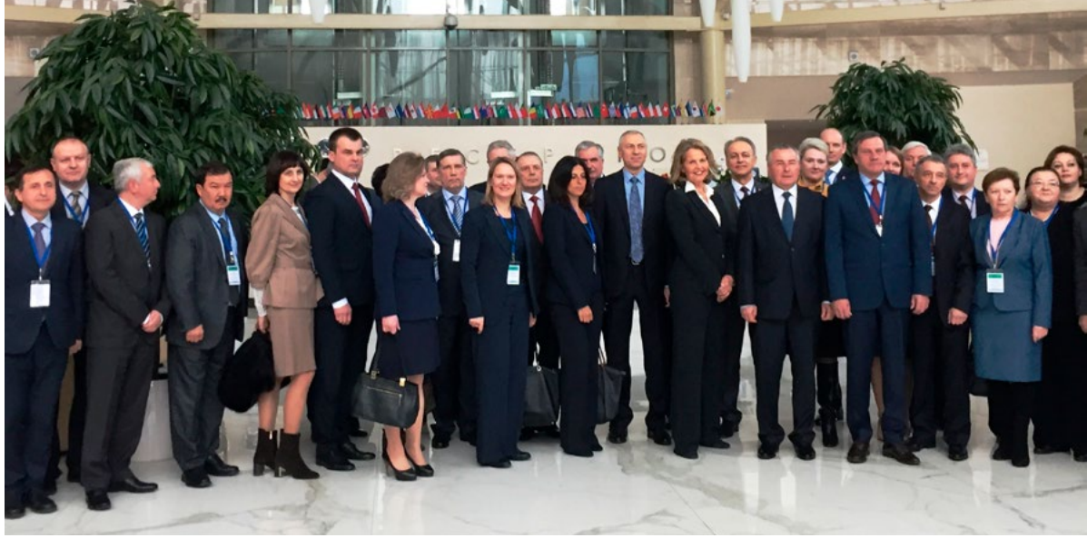
Participants de la Conférence sur les organes de contrôle de la constitutionnalité et l'état de droit, Minsk, avril 2017

de Venise au titre du programme conjoint du Conseil de l'Europe et de l'Union européenne Partenariat pour une bonne gouvernance conclu avec l'Arménie, l'Azerbaïdjan, la Géorgie, la République de Moldova, l'Ukraine et le Bélarus – renforcer la justice constitutionnelle.